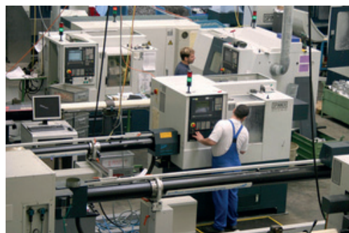
Abb.7: Fertigung der MLS Lanny GmbH - Produktion auf modernsten CNC-Maschinen